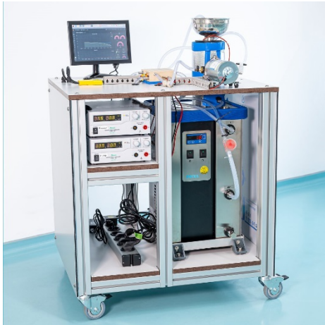
Mobile Reaktoranlage für den Vor-Ort-Einsatz.